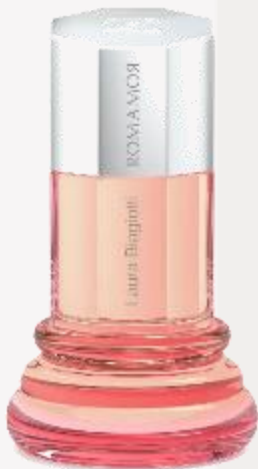
Donna 50 ml