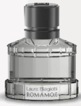
Uomo 40 ml