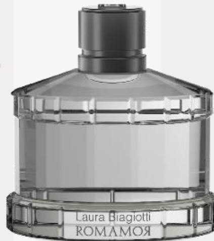
Uomo 125 ml