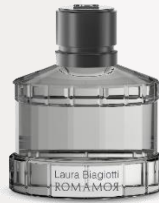
Uomo 75 ml