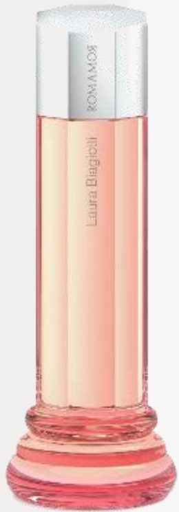
Donna 100 ml