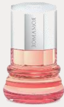
Donna 25 ml